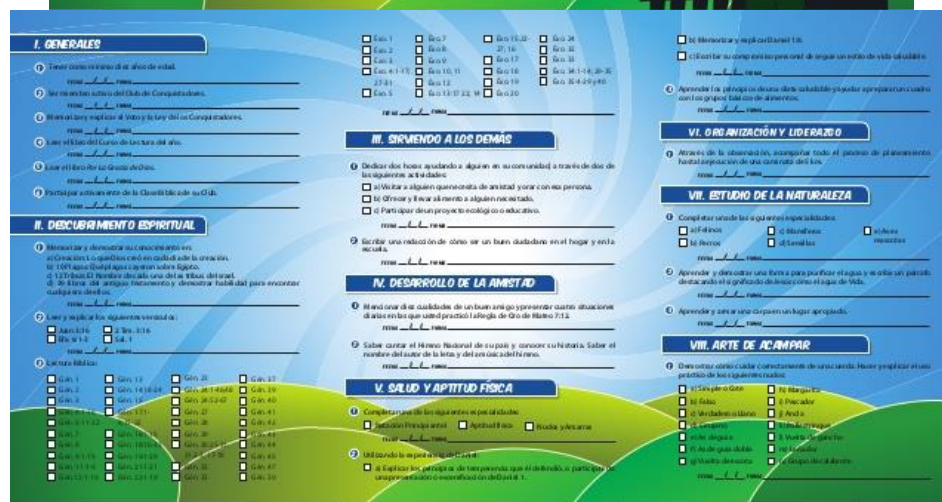
Figura 3. Clases Amigo y Amigo de la Naturaleza.