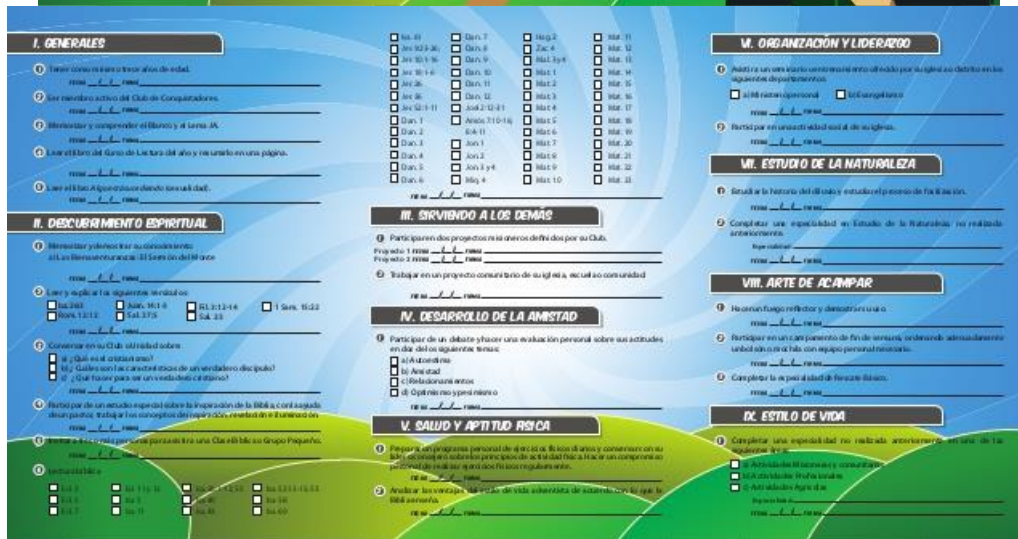
Figura 6. Pionero y Pionero de Nuevas Fronteras.