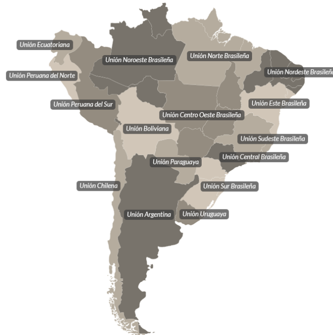
Figura 1. División Sudamericana dividida por sus Uniones.

Adventista Del Séptimo Día”, ya que, estos eran uno de los pilares de su fe; el advenimiento de Cristo y el verdadero día séptimo del cuarto mandamiento del libro de Éxodo. 59