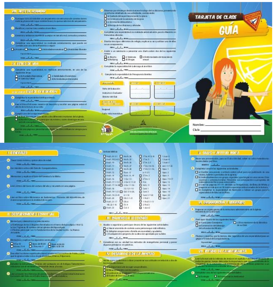
Figura 8. Guía y Guía de Exploración.