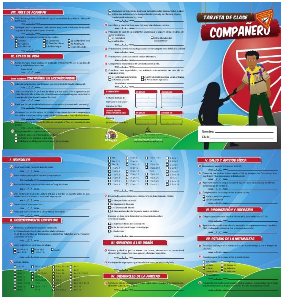
Figura 4. Clase Compañero y Compañero de Excursionismo.