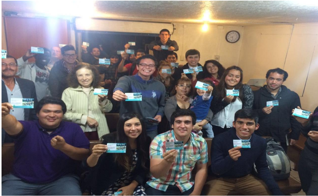
Figura 8. Entrega de las respectivas invitaciones a la comunidad para la Expo-Salud