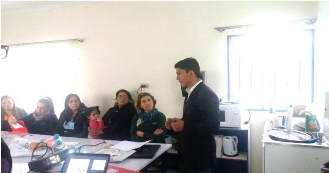
Figura 17. Educadoras inician el programa de salud, basado en los ocho remedios naturales.

Se muestra los resultados de esta segunda etapa en las figuras 17, a la 22, funcionarias del Jardín Infantil Mis Primeros Sueño.