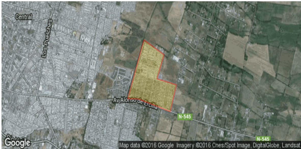
Figura 1. Complejo residencial Doña Rosa. 9

Considerando la información de la tabla número 1 con respecto al número de habitantes en la villa de Doña Rosa, 5.452 personas, y los datos de la tabla número 2, cantidad de Adventistas que viven en el sector y que asisten al grupo Horeb, se puede decir que por cada 454 vecinos del sector Doña Rosa hay 1 Adventista.