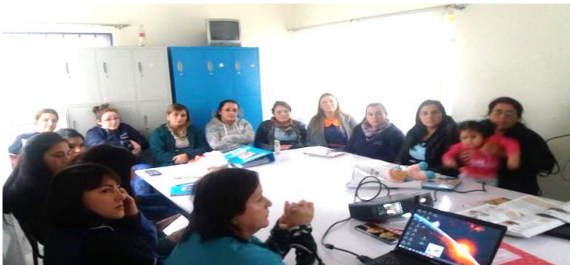
Figura 18. Docentes en su primera clase de vida saludable.