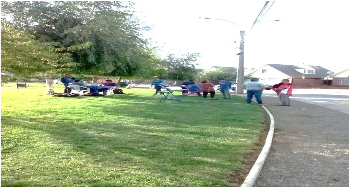
Figura 3. Talleres de salud en la plaza de Doña Rosa.