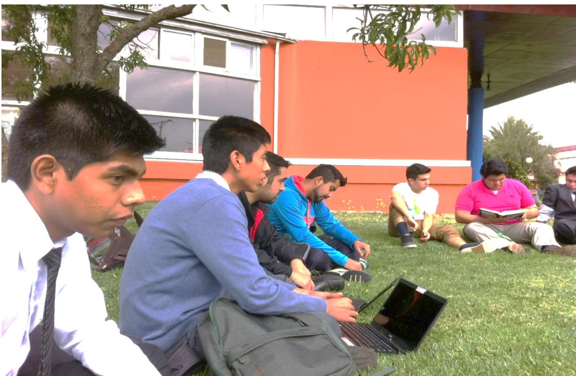
Figura 2. Durante las capacitaciones los alumnos recibieron instrucciones, para finalmente poder ejecutar este proyecto.

El día viernes 11 de marzo del 2016 se dio inicio a la primera capacitación al grupo especial de Evangelismo en salud, a los alumnos del primer año de teología. 84 El total de las capacitaciones fueron siete, teórico y práctico, en la cual se mostrará en la siguiente figura.