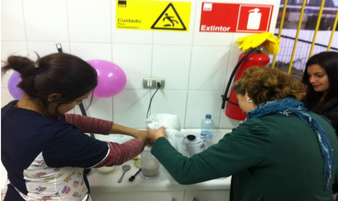
Figura 19. Directora del jardín y educadoras, participando de uno de los talleres en cuanto a los ocho remedio naturales.