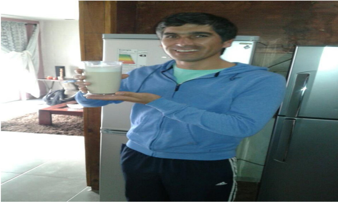
Figura 28. Profesor de Educación Física, realiza taller de alimentación.