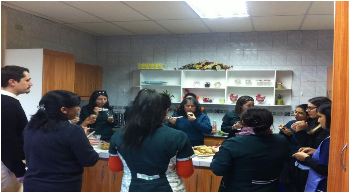
Figura 23. Esa tarde se preparó leche de almendra, leche de nueces; pan integral y panqueques, pates de semilla de girasol, además unos ricos queques nutritivos y granola.