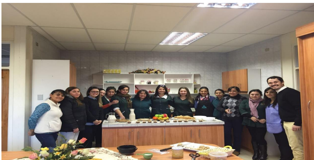
Figura 21. Directoras realizan primer taller de alimentación saludable.