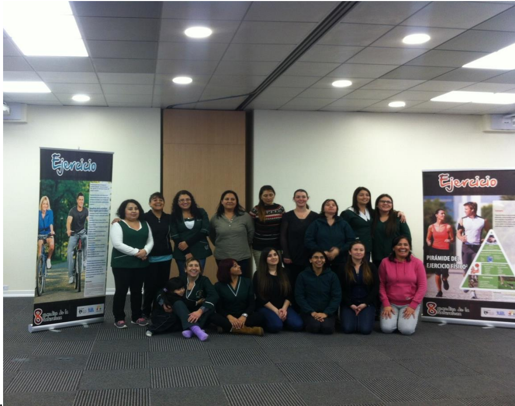
Figura 24. Se realizó el acondicionamiento físico