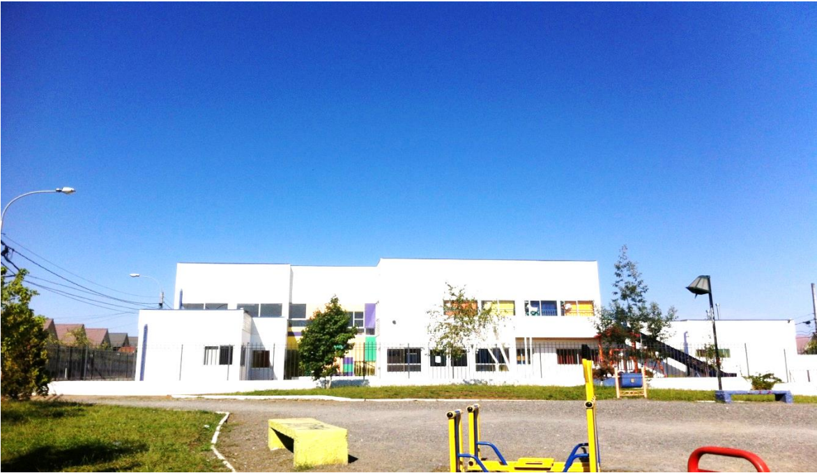
Figura 9. Jardín Infantil Mis Primeros Sueños.