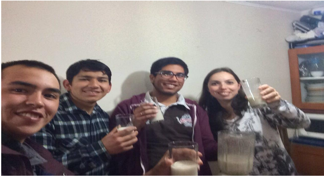
Figura 25. Se muestra los talleres de alimentación saludable.

mientras que en la figura 27, 28 y 29 se muestran como las personas en la segunda etapa tomaron la decisión de estudiar la Biblia.