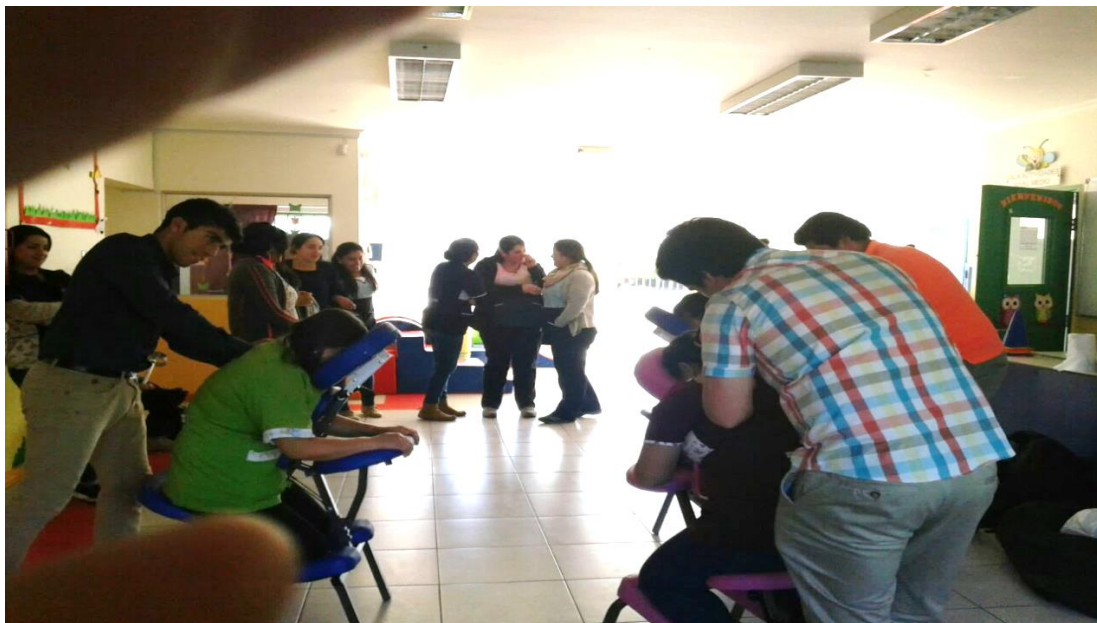
Figura 26. Docentes del Jardín Mis Primeros Sueños, realizan el taller del descaso.