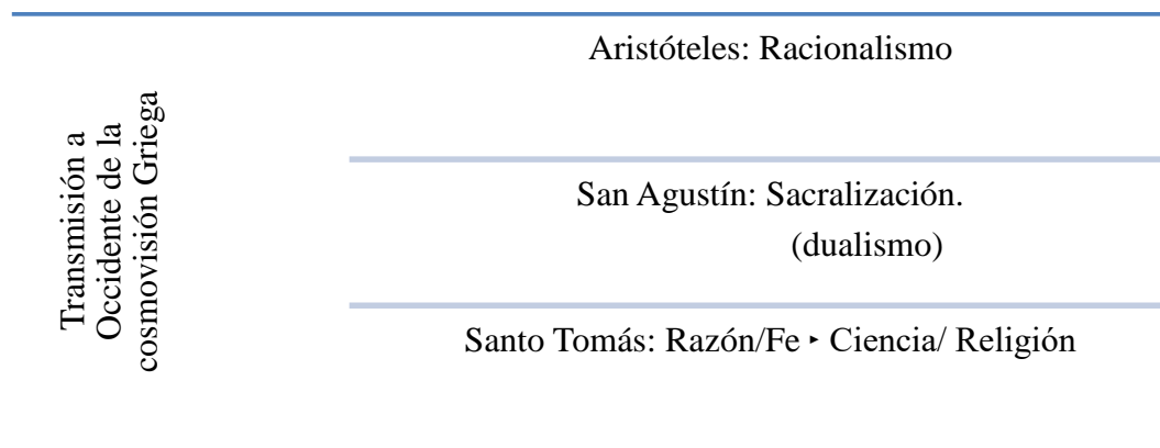
Figura 3. Consecuencias de la Cosmovisión Griega en Occidente.

El resultado de las conclusiones teológicas y filosofías de Tomás de Aquino se pueden ver en el siguiente gráfico 37 :