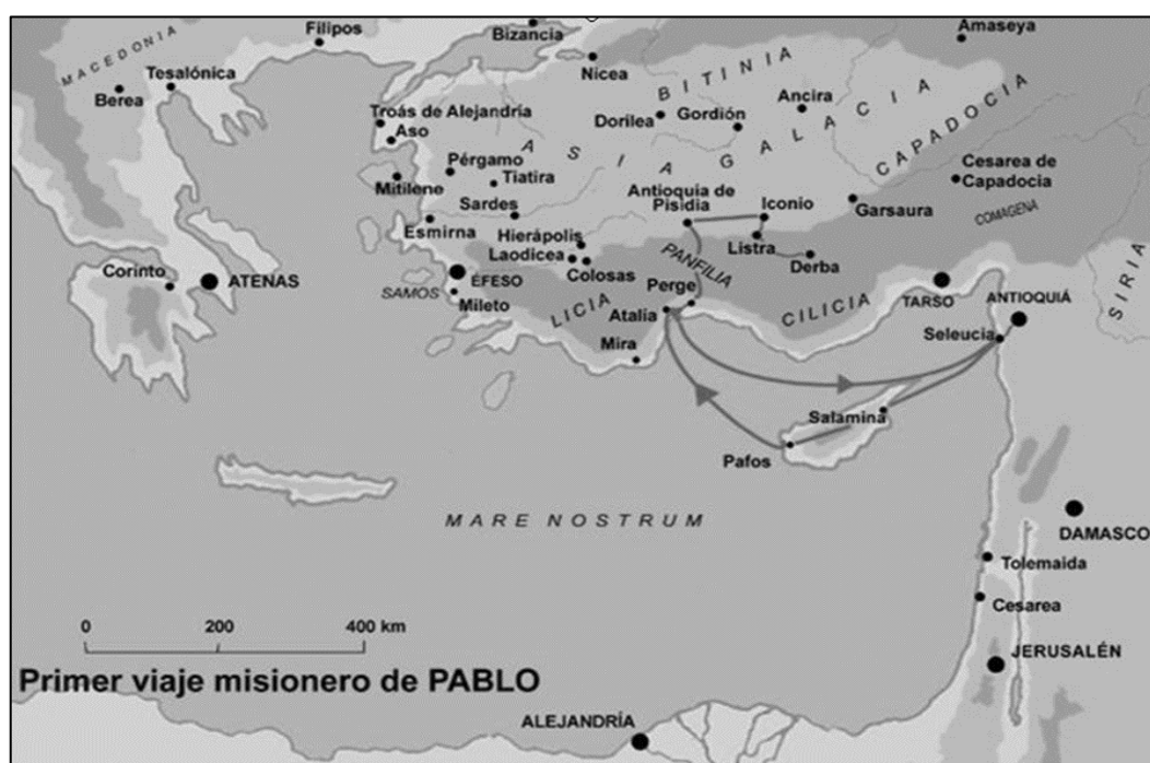
Figura 1. Primer viaje misionero de Pablo.

A continuación, viajó a Macedonia para dirigirse a Acaya donde pasó tres meses regresando a Filipos, para finalmente hacer su regreso a Jerusalén, más tarde la hostilidad de los judíos lo hizo ir a Roma, todos estos elementos están más detallados en el Atlas Bíblico Oxford . 24