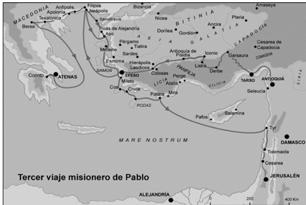
Figura 3. Tercer viaje de Pablo.

Fuente: SOBICAIN, “Segundo viaje de Pablo” [pág. web]. http://www.sobicain.org/imagen.asp?nombre=Voyage2_Paul.jpg&idno=213