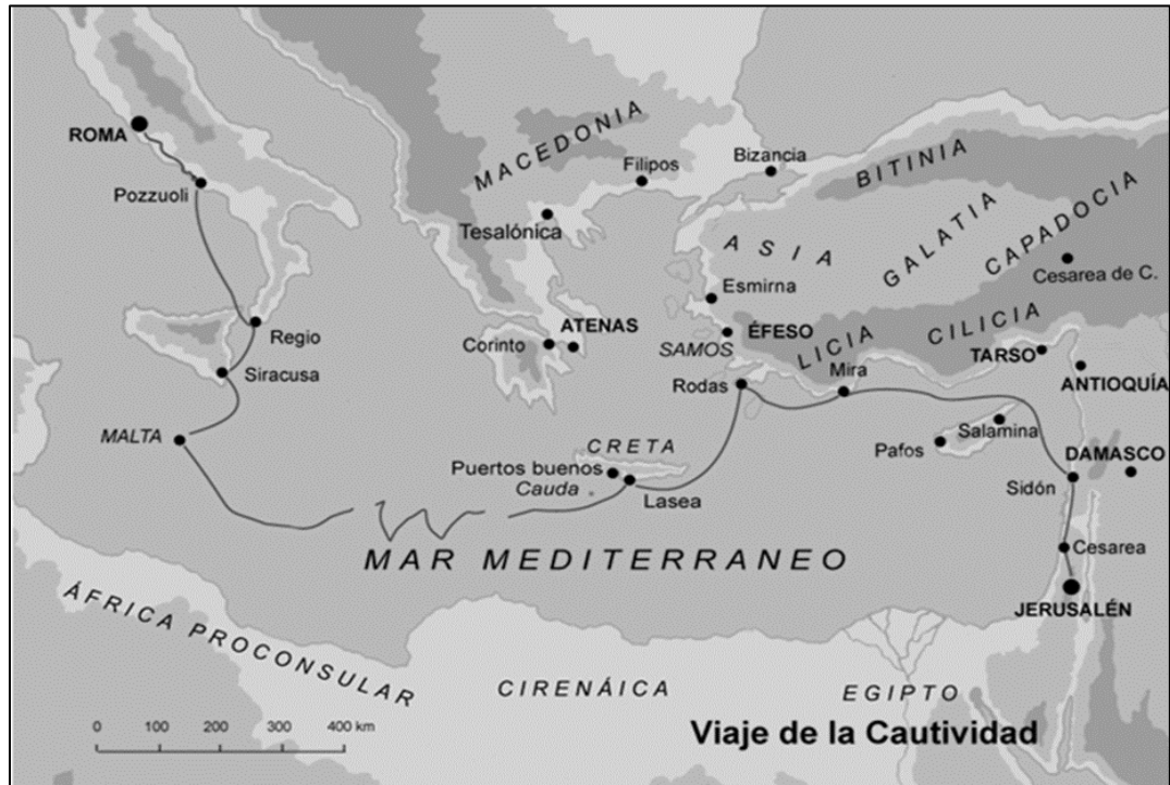
Figura 4. Viaje de la cautividad hacia Roma.

Fuente: SOBICAIN, “Viaje de la Cautividad” [pág. web].