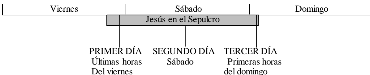
Figura 4. La crucifixión en relación a la Pascua. 251

Otro punto fuerte que se encuentra en el texto bíblico es la profecía de Daniel de los 2.300 años y las 70 semanas, ya que estas ayudan a la exactitud en la fecha de la muerte de Cristo.