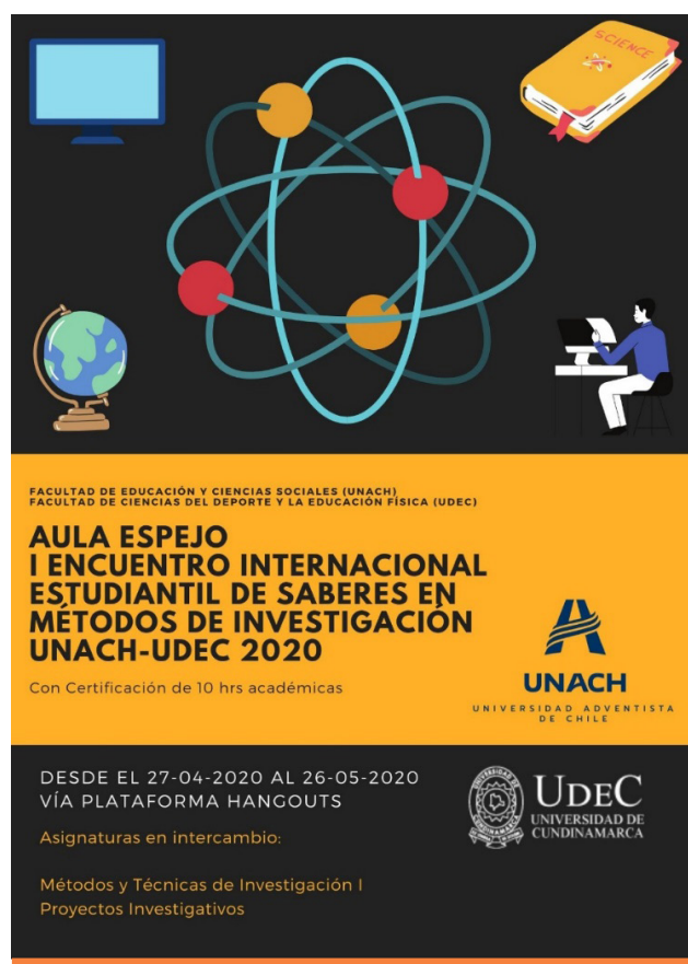
Figura 1. Aula Espejo UnACh-UdeC, 2020.