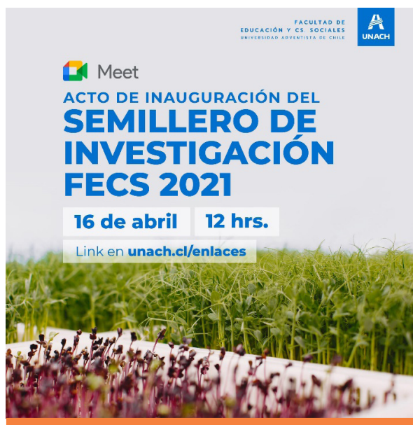
Figura 2. Semillero de Investigación FECS, 2021.

Se avanzó con la incorporación de mecanismos de progresividad de la investigación por carrera, a través de un tejido de implicaciones de los grupos de investigación asociados en los que participan los profesores de las respectivas carreras, estudiantes colaboradores de investigación, temas de TFI-TFC con proyección a 3-4 años, líneas de investigación de la carrera, etc. Y de esta instancia surge el avance en términos de presentar la propuesta de creación de semilleros de investigación (Ver Figura 2), incorporando además estudiantes como colaboradores en proyectos de investigación de profesores de las diferentes carreras, obteniendo algunos resultados en el año 2020 con estudiantes que participaron como coautores en el artículo publicado por Reyes et al. (2021); además de tener participación como ponentes en eventos de carácter internacional (Ver Tabla 2 en página siguiente).