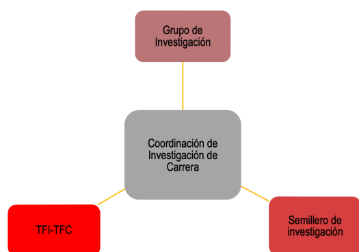
Gráfico 3. Estructura orgánica funcional de la investigación por carrera FECS.

La creación del semillero de investigación de la FECS fue un proyecto que comenzó a desarrollarse habida cuenta la necesidad de generar alternativas de formación en campo por la conversión de la malla curricular de 2013 y la supresión de dos asignaturas asociadas a investigación en la malla de 2018. A esto se sumó la planificación de hitos formativos (talleres prácticos) que permitieran ir trabajando con acciones prediseñadas y destinadas a atender a estudiantes de forma progresiva en la consecución de sus estudios, a saber: