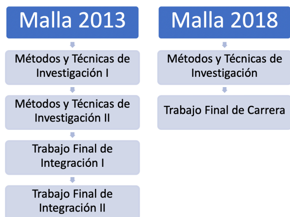
Gráfico 1. Asignaturas en mallas curriculares de las carreras de la FECS, UnACh.

En el caso de la Universidad Adventista de Chile (UnACh), y con especificidad en la Facultad de Educación y Ciencias Sociales (FECS), asignaturas asociadas a investigación y destinadas a la formación y desarrollo de habilidades investigativas básicas, se encuentran incorporadas a las mallas curriculares de sus once carreras (Reyes et al. , 2021), (Ver Gráfico 1).